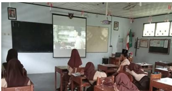
Gambar 5. Pembelajaran dengan menonton video melalui LCD

“Di sisi lain karena memang dengan teknologi digital dapat meningkatkan minat belajar siswa jadi mata Pelajaran PAI terkadang menggunakan teknologi digital seperti video sesuai materi yang ditampilkan pada layar LCD. Metode seperti itu menjadikan siswa lebih semangat belajar dan tak jarang siswa ingin menonton materi lain seperti kisah Nabi dan Rasul.” (Bapak Anang Makrup, S. Pd selaku Guru Pendidikan Agama Islam).