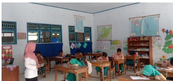
Gambar 4. Potret siswa dalam pembelajaran manual/tulis menulis

tugas-tugas siswa lebih sering menggunakan metode tulis tangan. Beliau juga mengatakan cara daya ingat anak sekarang masih kurang, dengan menulis setidaknya siswa tersebut mengingat apa yang mereka tulis. Menurut Bapak Anang Makrup jika materi ditulis di buku jika buku itu tidak hilang maka sewaktu siswa lupa dengan materi bisa membuka kembali buku tersebut.