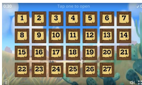
Gambar 2. Tampilan Wordwall

“Teknologi digital lainnya seperti Wordwall juga pernah saya pakai. Dengan konsep game online yang hampir sama dengan Quizizz. Jadi materi dan soal sudah kita kemas sedemikian rupa seperti permainan. Dengan seperti itu, fokus siswa sudah mengarah ke pembelajaran tersebut hanya dengan mendengarkan musik yang menyenangkan dan menggunakan LCD”. Jelas Ibu Munarti, selaku wali kelas 6 SD N 4 Pejagoan.