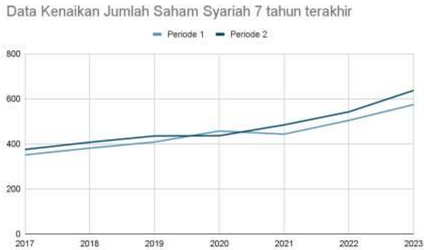
Gambar 1. Data Kenaikan Jumlah Saham Syariah 7 tahun terakhir

Pasar modal syariah di Indonesia terus mengalami pertumbuhan yang pesat. Berdasarkan Tabel 1, dapat terlihat peningkatan pasar modal syariah yang cukup signifikan dari tahun-tahun sebelumnya, 2017-2023. Jumlah saham syariah yang terdaftar pada tahun 2017 adalah 351 dan terus meningkat setiap tahunnya hingga 637 pada tahun 2023 periode 2. Pada periode 2 tahun 2023, Bursa Efek Indonesia (BEI) mencatat bahwa saham syariah telah mencapai 69,1% dari total saham yang tercatat di BEI. Bursa Efek Indonesia juga mencatat jumlah investor syariah yang mengalami peningkatan yang cukup signifikan dalam beberapa tahun terakhir.