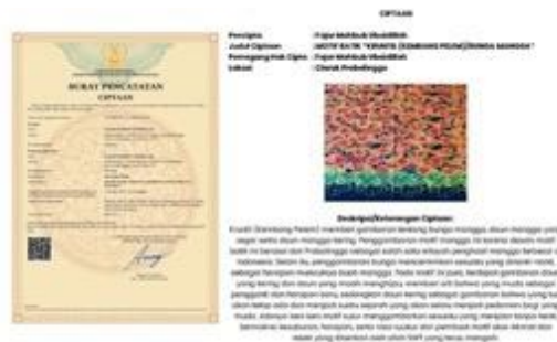
Gambar 5. Motif Batik “Kruntil”, salah satu produk UMKM Clarak milik Ibu Elisa, yang berhasil didaftarkan HAKI oleh tim peneliti

Selanjutnya, inisiatif pembuatan platform e-commerce Clarak Store telah direalisasikan untuk memfasilitasi penjualan produk UMKM secara online . Platform ini berfungsi sebagai pusat penjualan yang memudahkan konsumen mendapatkan produk lokal dengan mudah, sambil mendukung UMKM dalam mengelola inventaris dan transaksi penjualan mereka secara efektif.