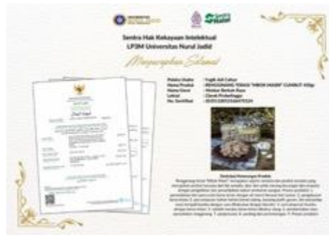
Gambar 3. AesQ, salah satu produk lokal UMKM Desa Clarak milik Ibu Niken, yang telah didaftarkan sertifikasi halal oleh tim peneliti

Untuk mengadaptasi pelaku usaha ke ekonomi digital yang berkembang, telah diadakan pelatihan dan pendampingan e-commerce. Pelatihan ini membekali pelaku usaha dengan keterampilan untuk mengelola toko online dan menerapkan strategi pemasaran digital, yang kritikal dalam meningkatkan visibilitas dan penjualan produk mereka di platform online.