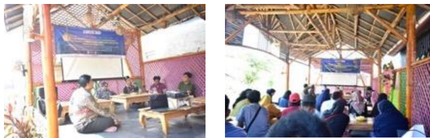
Gambar 2. Pelatihan Sertifikasi Halal dan Komersialisasi Produk bagi Para Pengurus BUMDES dan Pelaku Usaha UMKM Desa Clarak

Salah satu kegiatan yang telah berhasil diimplementasikan adalah pendampingan sertifikasi merek dagang, yang membantu pelaku usaha, terutama perempuan, dalam mendaftarkan produk mereka agar memiliki perlindungan hukum dan identitas yang kuat di pasar. Hal ini memberikan kepercayaan yang lebih kepada konsumen dan membuka lebih banyak peluang pasar.