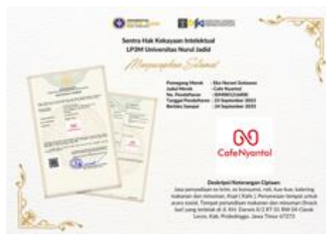
Gambar 4. Logo “Café Nyantol”, salah satu UMKM Kafe binaan BUMDES Clarak, yang berhasil didaftarkan sertifikasi merek dagang oleh tim peneliti

Untuk mengadaptasi pelaku usaha ke ekonomi digital yang berkembang, telah diadakan pelatihan dan pendampingan e-commerce. Pelatihan ini membekali pelaku usaha dengan keterampilan untuk mengelola toko online dan menerapkan strategi pemasaran digital, yang kritikal dalam meningkatkan visibilitas dan penjualan produk mereka di platform online.