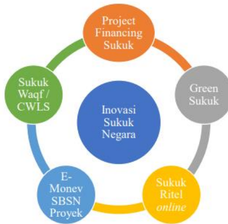
Gambar 1. Inovasi Produk Sukuk Negara