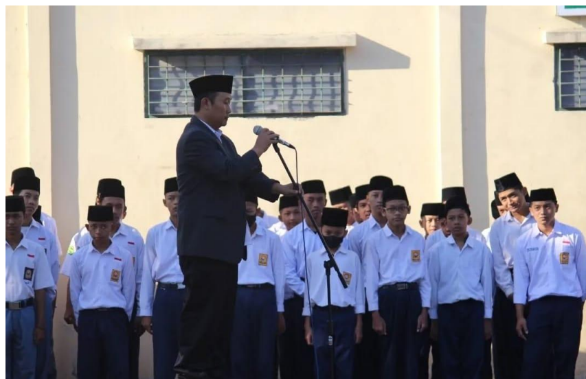
Gambar 1. Kegiatan Upacara