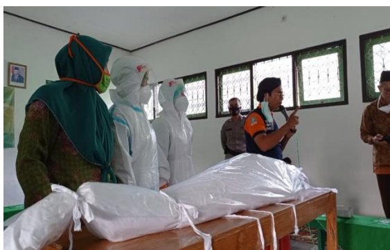
Gambar 1. Pelatihan Pemulasaran Jenazah COVID-19

Dengan diselenggarakannya acara ini, menjadi wadah bagi mahasiswa untuk lebih mengenal kebudayaan dan adat setempat, serta belajar untuk mengorganisir suatu acara/program dan melatih kerjasama tim. Jika dilihat dari Muslimat dan Fatayat, terlihat kekompakan warga NU dalam berorganisasi dalam menyiapkan berbagai hal. Berikut hasil dokumentasinya.