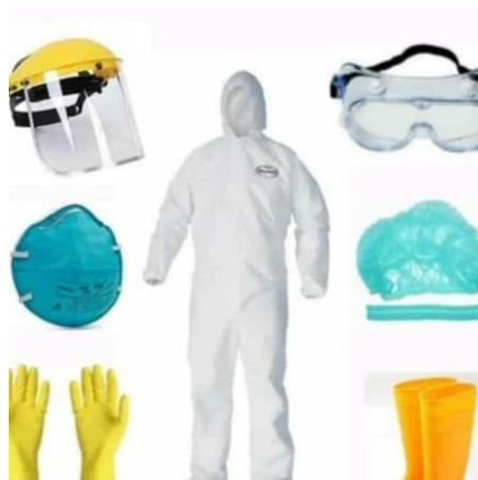
Gambar 1. APD Pencegahan COVID-19

merupakan perlengkapan wajib digunakan demi melindungi pekerja dari bahaya cedera atau penyakit serius yang berkaitan dengan pekerjaan. Alat pelindung diri didesain khusus sesuai jenis pekerjaan. Berikut contoh APD yang digunakan dalam pengabdian ini.